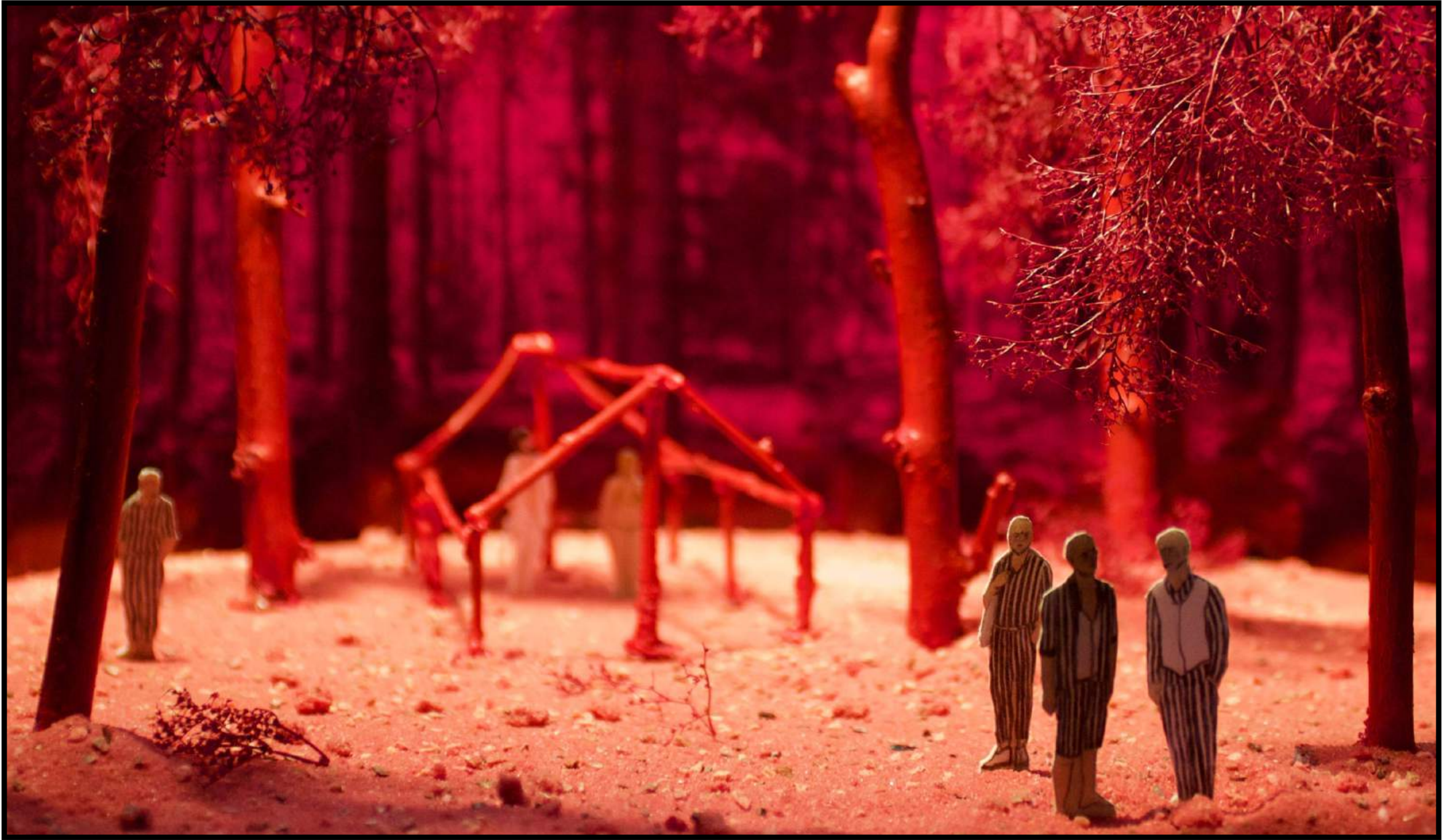
Bühnenbild „Gesäubert“ von Sarah Kane