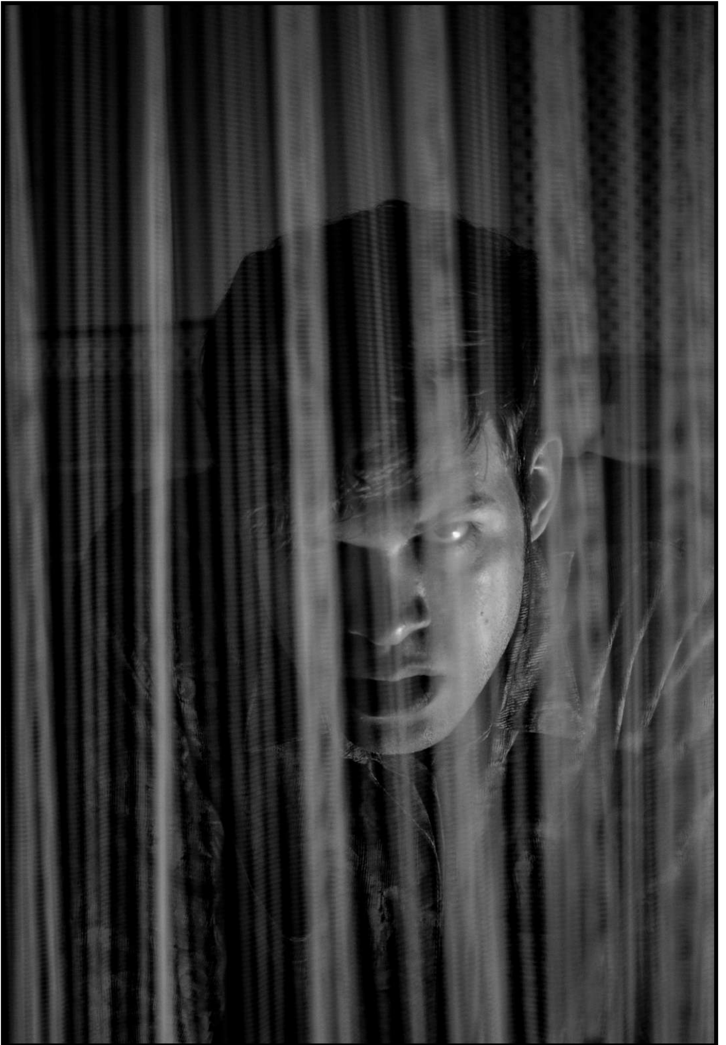
Hauptseminar „Der Bösewicht im rechten Licht“ (Auswahl)