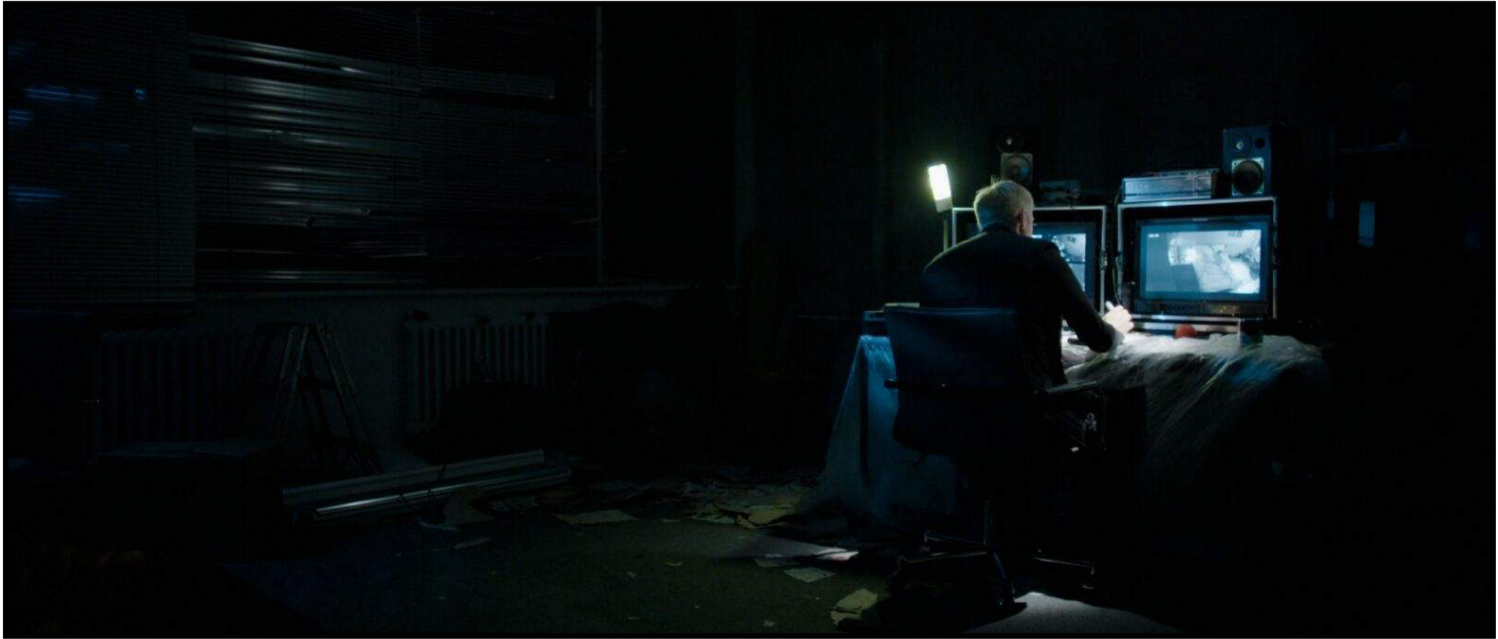
Kostüm Kurzfilm „Trennpunkt“ (AT)