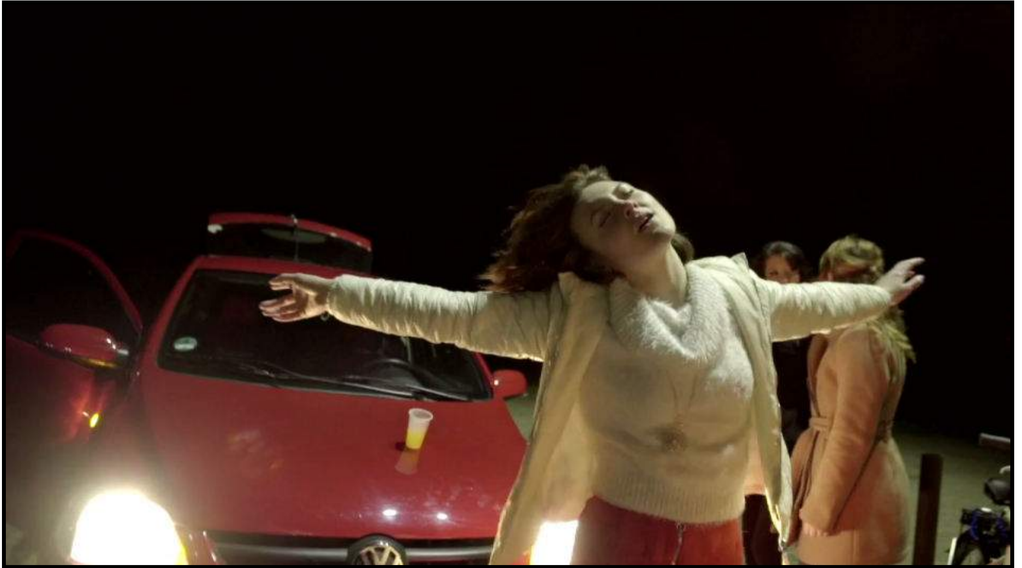
Kostüm Kurzfilm „TORONTO“ (AT)